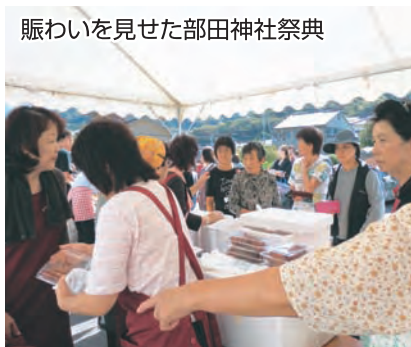
賑わいを見せた部田神社祭典

私たち女性部も、十二名の役員が、各分担を決め、三日前より仕込みに入り、トロはんぺん六百枚、あんみつ三百個、チョコバナナクレープ百個を、行列を作っているお客様に、数時間で完売させました。苦労の後の満足感が、仲間の絆を強く感じさせる一日になりました。