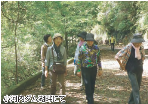
小河内ダム湖畔にて

中央高速から青梅、あきる野市を通り、そこは東京都とは思えぬ静かな町並でした。昼食のお食事処「三河屋」、その裏手は川のせせらぎが美しい奥多摩の雰囲気でした。さらにバスは進み、奥多摩湖・小河内ダムに到着。バスを降りた瞬間、空気の清々しさ、木々の緑の深さに感動し、素晴らしい自然の中で湖畔