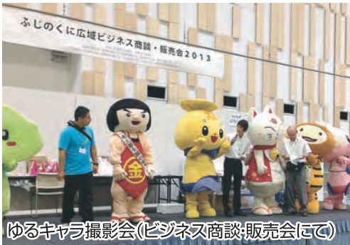
ゆるキャラ撮影会(ビジネス商談・販売会にて)

本会員からは、林製作所(株)S D R、ベル印刷(株)、(株)こだわり工房、ツツミ水産、(有)山信水産、(有)坂弥水産、殿岡服飾工業(株)、愛昌園茶舗、石田茶業、(有)マルニ茶業の十一社が出展しました。